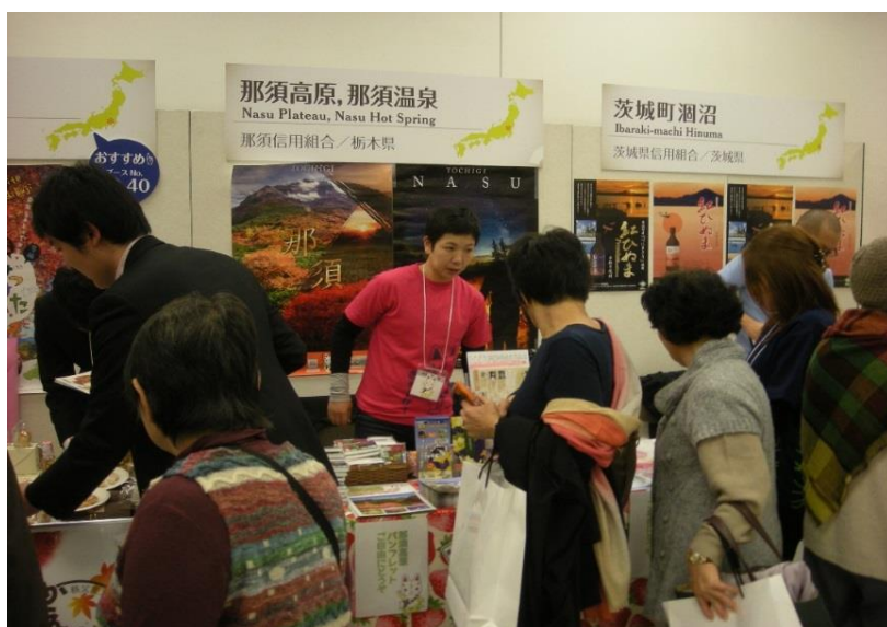
しんくみ食のビジネスマッチング展（27年11月）

平成 27 年 1 月には、経営のプロフェッショナルスキルを磨くお手伝いをする事により、地元経済の将来的な安定的継続・発展に寄与することを目的として「なすしん経営塾」を創設いたしました。「なすしん経営塾」には地元企業の経営者・後継者・経営幹部の方々が集い、総勢で 86 名の受講生が集まり、同年 5 月に第 1 回、7 月に第 2 回、10 月に第 3 回勉強会を開催いたしました。平成 28 年 1 月には最終回となる第 4 回勉強会の開催を予定しております。