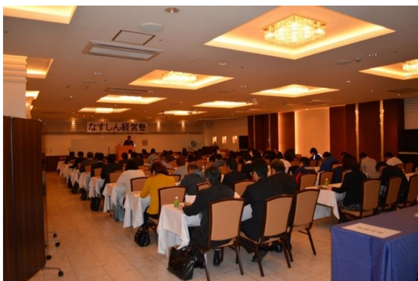
なすしん経営塾（27年10月）

「なすしん経営塾」終了後には、なすしん経営塾受講生の皆様と当信用組合の継続的な関わりの場とするために、平成 28 年 4 月に地域・受講生・そして当信用組合が共に成長・発展していくという「好循環」の実現に向け取り組んでいくことを目的とした「なすしん経営クラブ」を創設いたします。