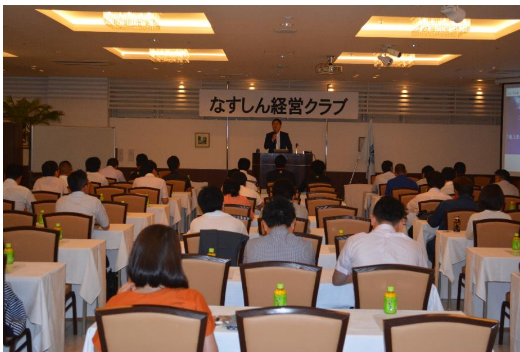
【平成29年7月14日 なすしん経営クラブ 経営セミナー】

今後も、組合員の皆様と当信用組合の継続的な関わりの場、創業又は新事業の開拓の場として、地域・組合員・そして当信用組合が共に成長・発展していくという「好循環」の実現に向け取り組んで参ります。