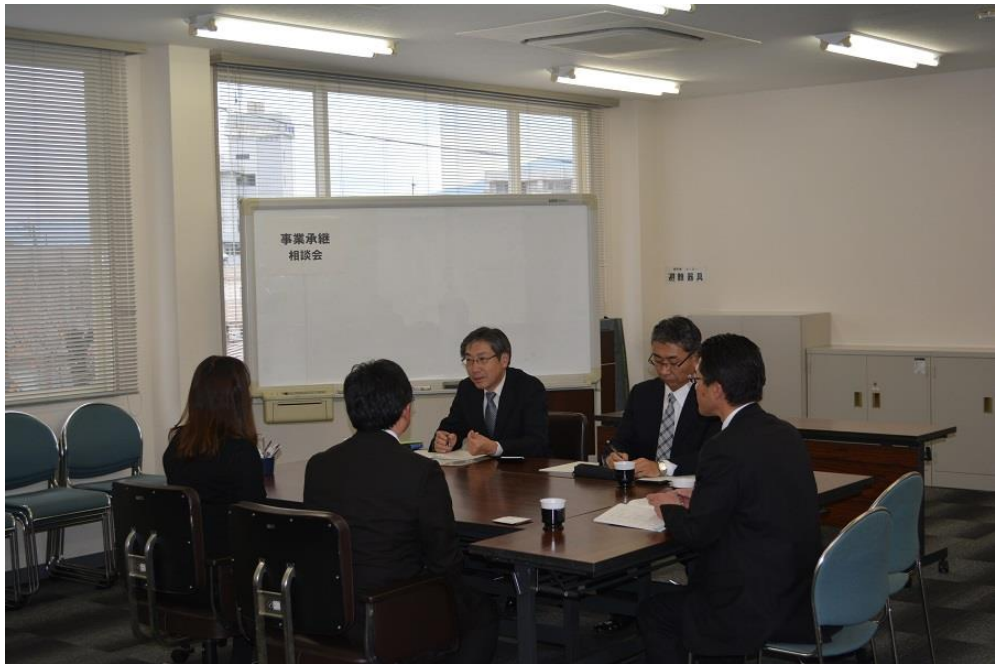
【平成 29 年 11 月 27 日 事業承継・M&A 相談会】