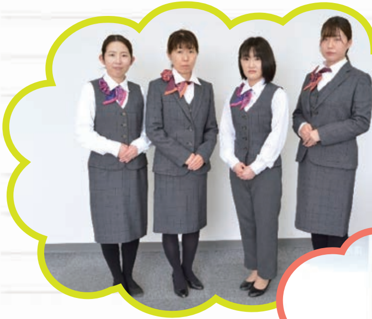
令和4年4月1日 女性職員の制服新調!