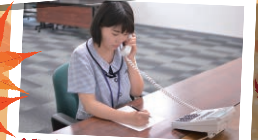
令和4年7月27日 NTTユーザー協会電話対応コンクール 地区予選