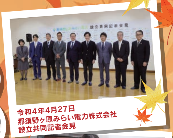
令和4年4月27日 那須野ヶ原みらい電力株式会社 設立共同記者会見