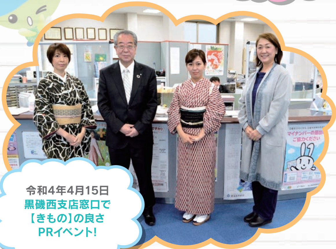
令和4年4月15日 黒磯西支店窓口で 【きもの】の良さ PRイベント!