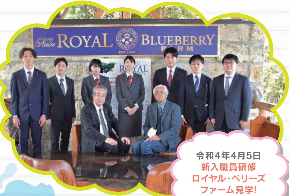
令和4年4月5日 新入職員研修 ロイヤル・ベリーズ ファーム見学!