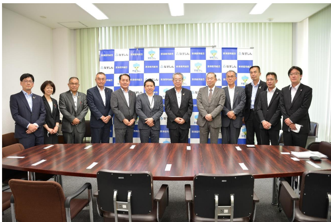
ご視察の皆様との記念撮影 (撮影のためマスクを外しております)