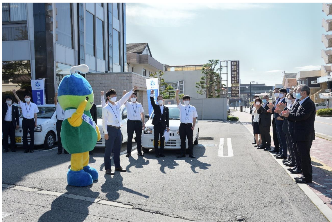
当日朝の出発式の様子 No.2