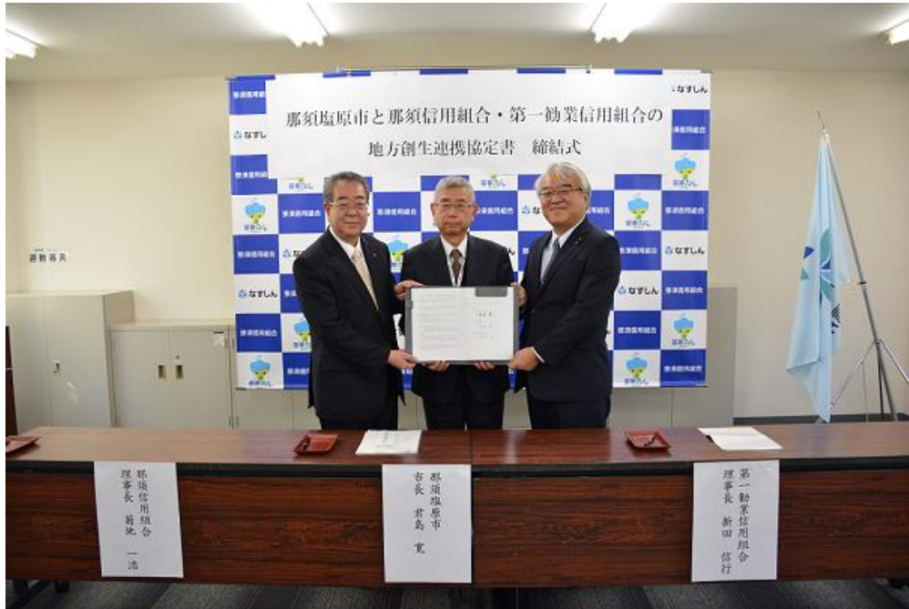
【2018年12月12日 那須塩原市・第一勧業信用組合・那須信用組合の 3者で地方創生連携協定締結】