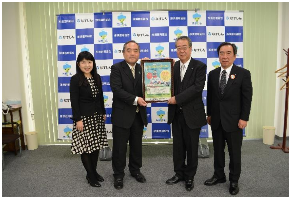
【2018年11月27日、日本政策金融との協調融資商品 「創業サポートローン・ハッスルトウギャザー」の取扱開始】

更に、中小企業の新たな事業活動の促進に関する法律に基づく経営革 新等支援機関として、取引先企業の各種補助金採択の支援を行なうこと や栃木県信用保証協会の「経営安定化支援事業」を積極的に取り組むこ とで経営改善支援を行なっております。その他、民間のコンサルタント 会社と提携を結び創業支援等の強化を図っております。