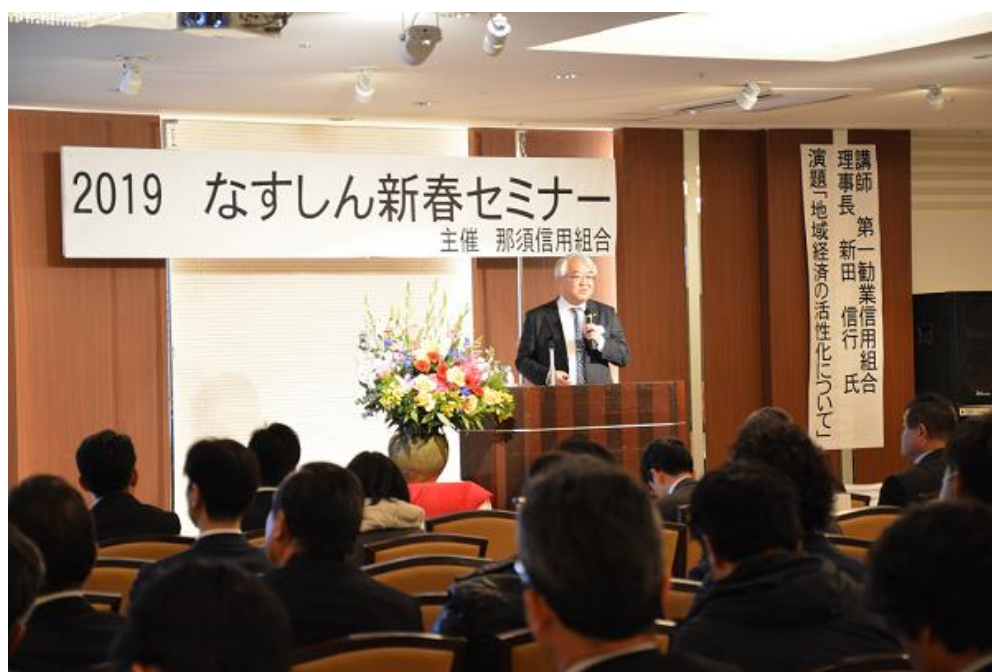
【2019年1月28日 なすしん新春セミナー】

今後も、組合員の皆様と当信用組合の継続的な関わりの場、創業又は新事業の開拓の場として、地域・組合員・そして当信用組合が共に成長・発展していくという「好循環」の実現に向け取り組んで参ります。