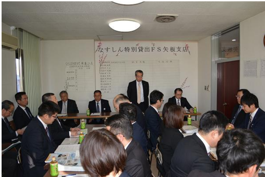
【2019年2月21日 矢板支店で実施した特別貸出FS】

また、同チームの主たる業務は、新規開拓および既存取引先を中心とした中小零細事業者への円滑な信用供与ですが、「事業再生・地域活性化支援チームなすしん」との連携や塩沢信用組合より学んだ「特別貸出FS（フィールド・セールス）」活動を実施することにより、地域の中小零細事業者への円滑な信用供与、再生支援、経営支援にも積極的に取り組んでおります。同チームの取り組み状況については、進捗管理委員会において、PDCAサイクルの考え方を基本に諸施策の進捗状況を月次で管理し、必要に応じ営業推進部担当役員が改善を指示し、継続して実効性を高めるよう管理して参ります。