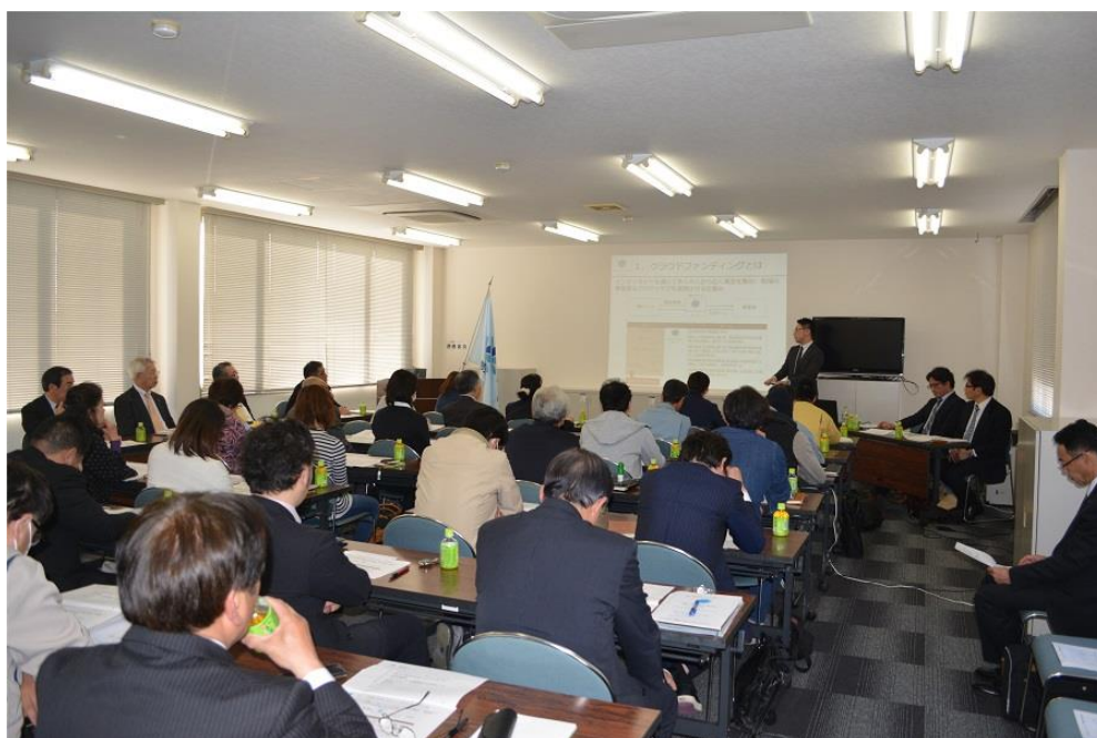
【平成 29 年 4 月 14 日 クラウドファンディング説明会】