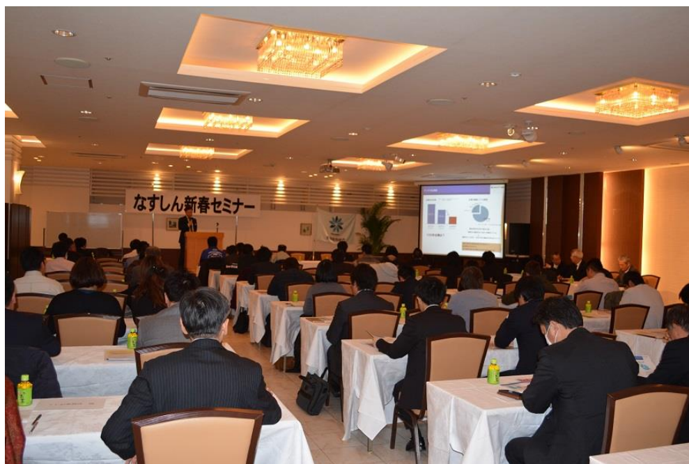
【平成29年2月3日 なすしん経営クラブ 新春セミナー】